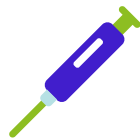
Stap 2 Labtest