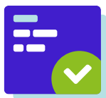
Stap 1 Vragenlijst

Het onderzoek is een praktisch hulpmiddel om jouw medewerkers te helpen gezonder te leven. Een soort APK voor jouw organisatie en medewerkers. De check combineert online vragenlijsten met metingen. De metingen worden met de checkbox door de deelnemer thuis uitgevoerd, of met hulp van onze medewerkers bij een checkpoint op locatie. Op basis van het inzicht worden deelnemers doorverwezen naar passende vervolgstappen.